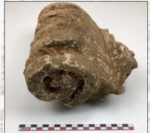
Chapiteau de pilastre