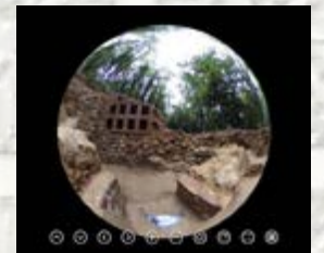
Pièce à alcôve vue intérieure à 360°