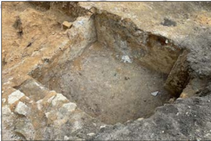
Pièce de service

L'extension de la fouille du côté du péristyle d'entrée a également permis d'observer une belle pierre moulurée, qui se trouvait en façade du bâtiment, aujourd'hui enfouie car le chemin actuel est environ en surplomb d'un mètre par rapport au niveau de sol ancien.