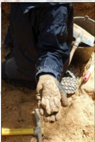
Découverte d'une main en plâtre