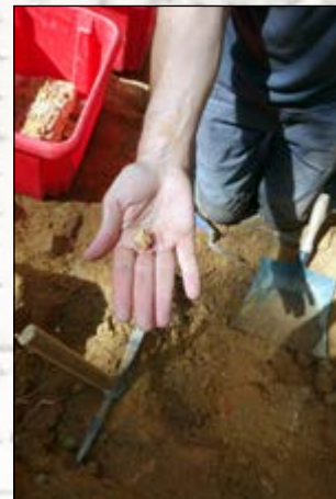
Découverte d'un dé à jouer