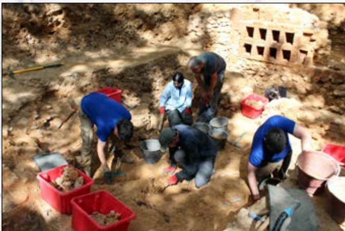
8 e jour de fouilles

Mais seul un vaste projet de couverture du site permettrait de dégager l'ensemble des vestiges (et de les montrer au public) car, en raison de leur fragilité, nous avons été contraint jusqu'ici de les protéger et surtout de les remblayer de nouveau.