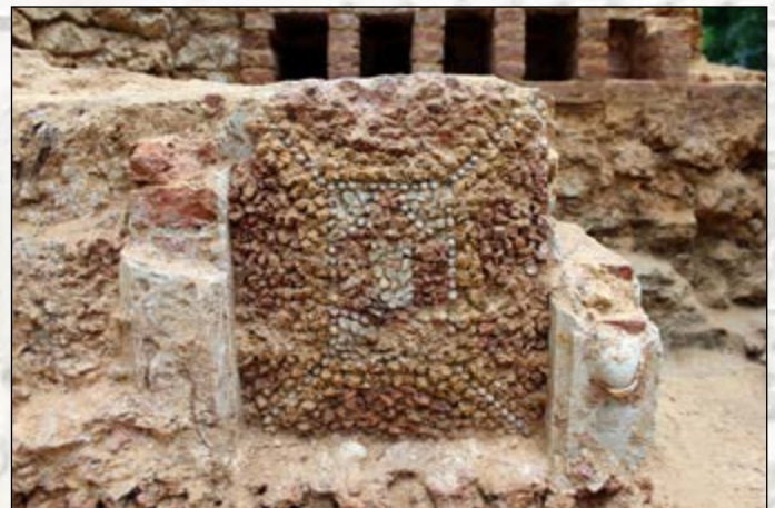
Décor en place dans la salle du portique