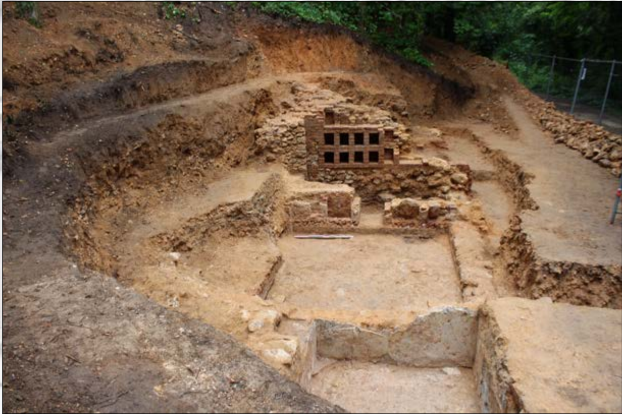
Vue d'ensemble de la fouille