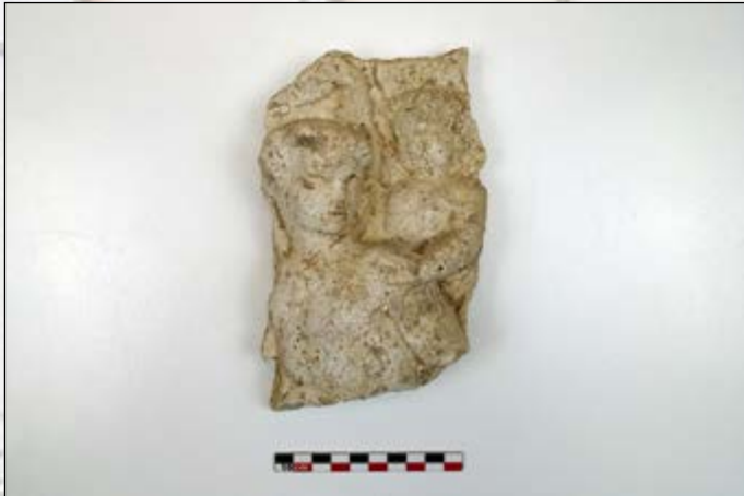
Mercure portant Bacchus

D'autres petits objets mobiliers en céramique (poterie), en métal (bougeoir) ou en os (dé à jouer) ont été retrouvés parmi les remblais de démolition : leur datation la plus probable est celle de la dernière période d'occupation à la fin du XVII e siècle après l'acquisition du domaine par Louis XIV.