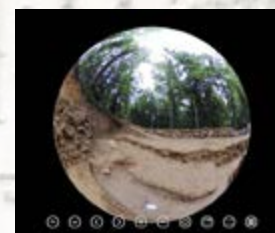
Arcade du mur de soutènement vue extérieure à 360°