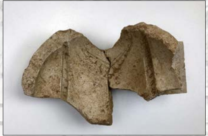
Moule en plâtre d'un buste féminin