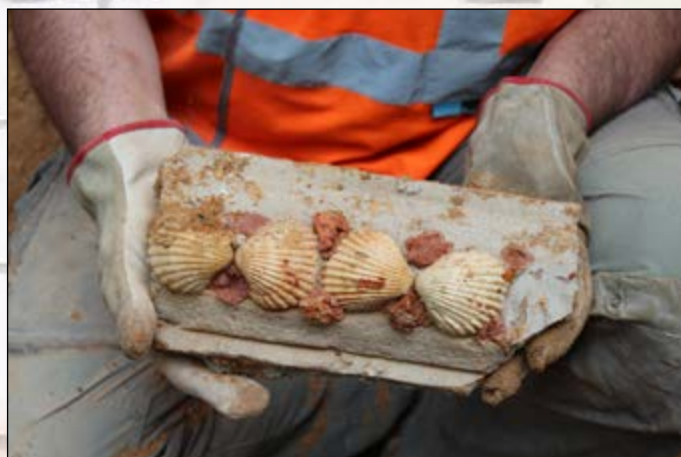
Découverte d'un décor