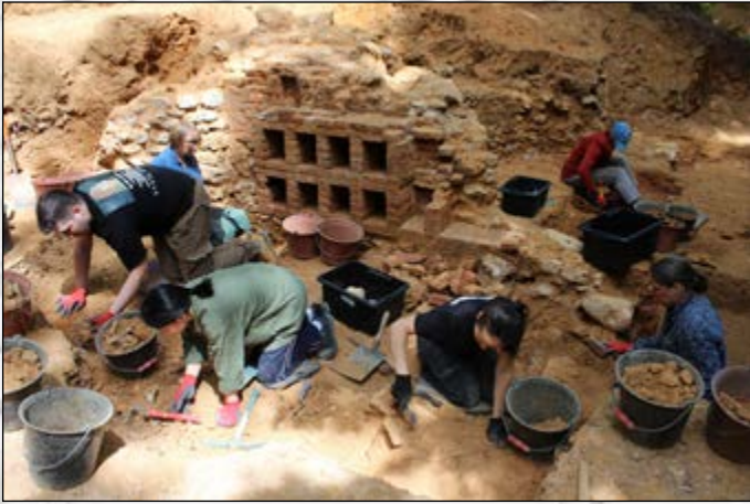
4 e jour de fouilles

La découverte de plusieurs fragments de moules en plâtre révèle la présence d'un atelier de fabrication sur place pour la décoration sculptée de la grotte. Ces moules en creux représentent notamment un buste féminin et un serpent. Ils datent probablement de la création des décors vers 1580, pour la fabrication de bas-reliefs en séries. Ils ont nécessairement été abandonnés lors de la démolition, ce qui indique qu'ils avaient été conservés, peut-être dans cette pièce.