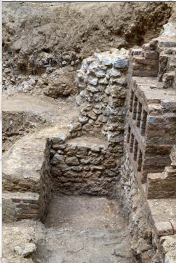
Niche du mur nord