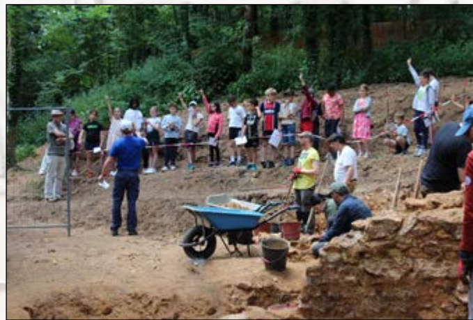
Jeu 3 juillet : visites scolaires pour les écoles de Noisy-le-Roi et de Bailly