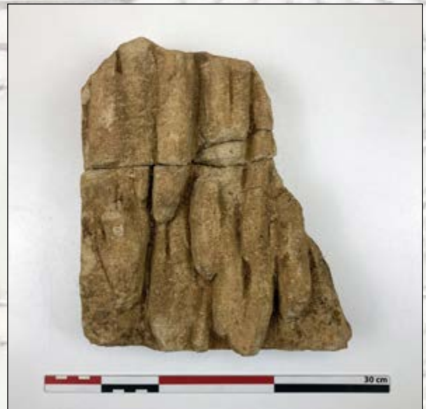
Pierre de congélation