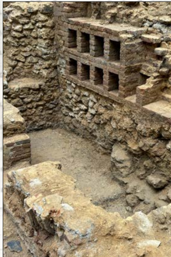
Petites alcôves dans le mur est