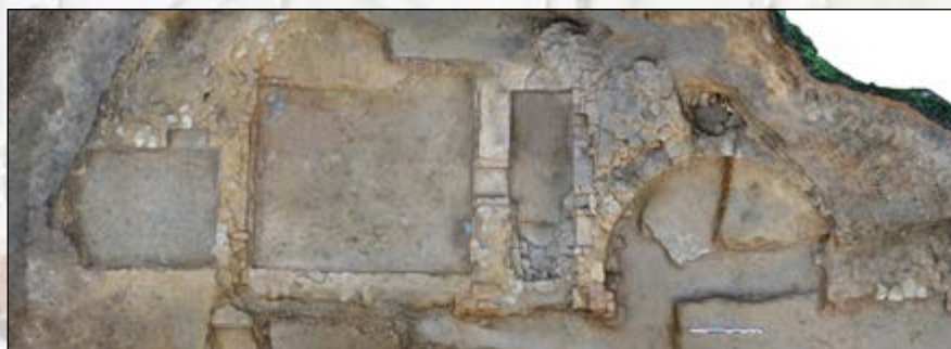
Orthophotoplan des fouilles 2024