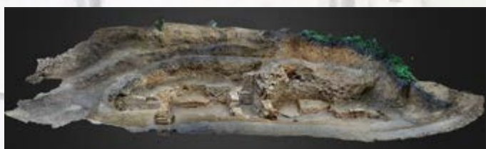
Grotte de Noisy, fouilles 2024 Photogrammétrie 3D