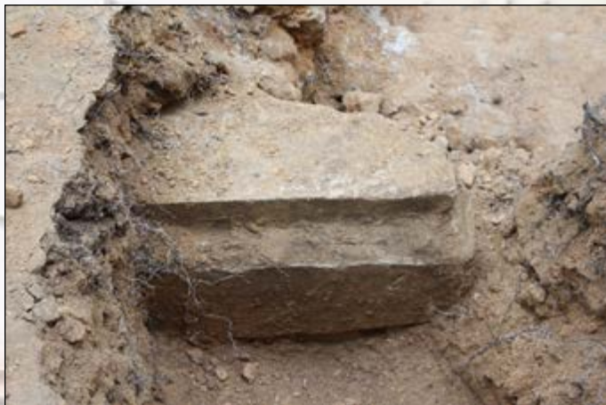
Mur de façade de la grotte