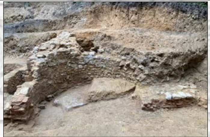
Arcade du mur de soutènement