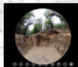
Pièce de service vue intérieure à 360°