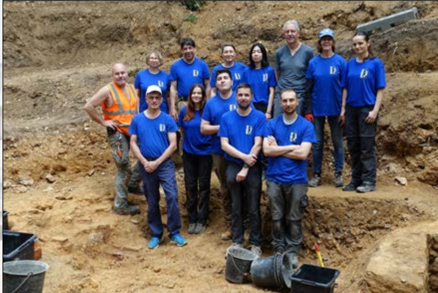
Équipe de fouilles 10.7.24

Fouilles archéologiques - 1 er au 15 juillet 2024