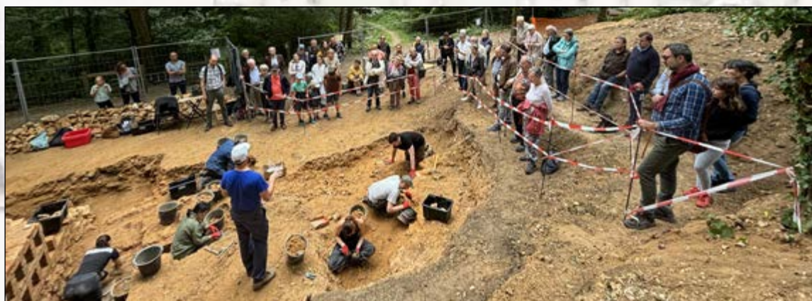
Visite du chantier le samedi 10 juillet 2024