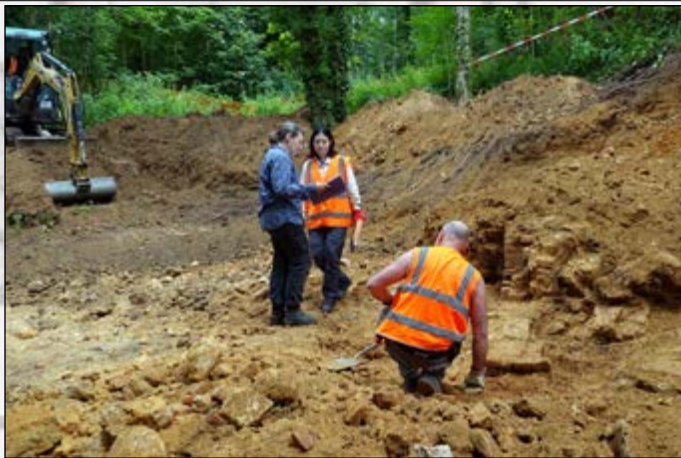
1 er jour de fouilles

L'absence de vestiges provenant du salon de l'étage dans les remblais intérieurs de la grotte s'explique probablement par l'entière démolition des parties hautes avant celle des parties basses. Il est néanmoins possible que certains éléments trouvés dans le comblement de l'arcade proviennent du salon supérieur. C'est peut-être le cas d'un unique fragment de plâtre peint et de deux fragments de volutes en plâtre provenant d'un chapiteau de pilastre.