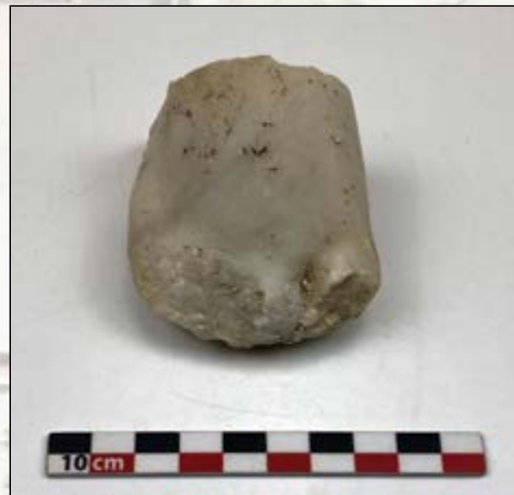
Pied de putto en marbre