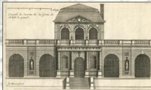
Grotte de Noisy vers 1650 par Jean Marot