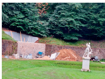
Théâtre de verdure

Des réunions techniques organisées par la Voirie interdépartementale ont eu lieu en présence de l'EPV, du musée, de la mairie de Marly-le-Roi et des Amis. La mise en place de nouveaux panneaux devrait être effective au cours du 1er semestre 2025.