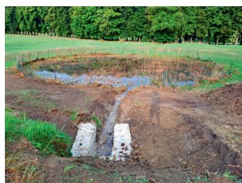
Bassin des Muses