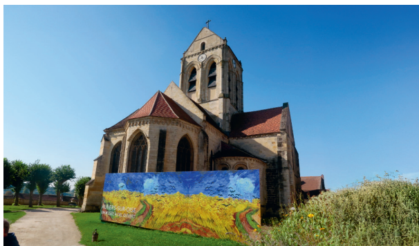
Eglise ND de l'Assomption

Jeudi 19 septembre 2024, une vingtaine d'Amis se sont rendus "sur les pas de Van Gogh ».