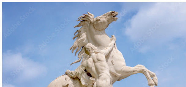
Chevaux de Marly