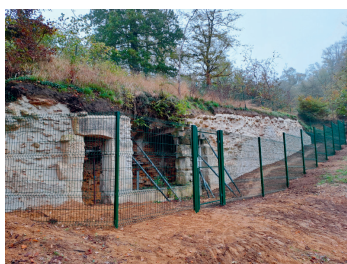
Mur des communs